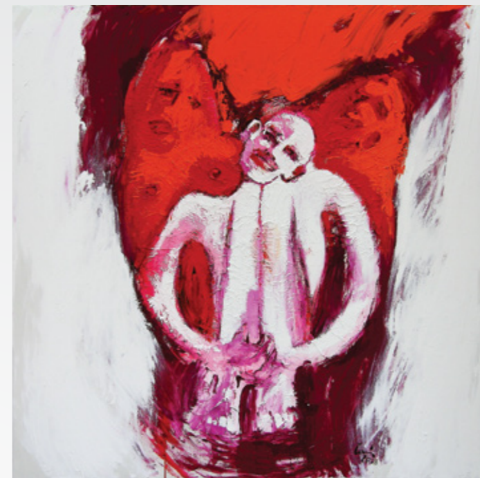
Winter 150 x 150 cm

Fokus Kunstsammlungen. Das BURN-IN Portfolio umfasst somit über 800 Kunstwerke, das wir 2020 vermehrt auch Kunstsammlungen anbieten werden.