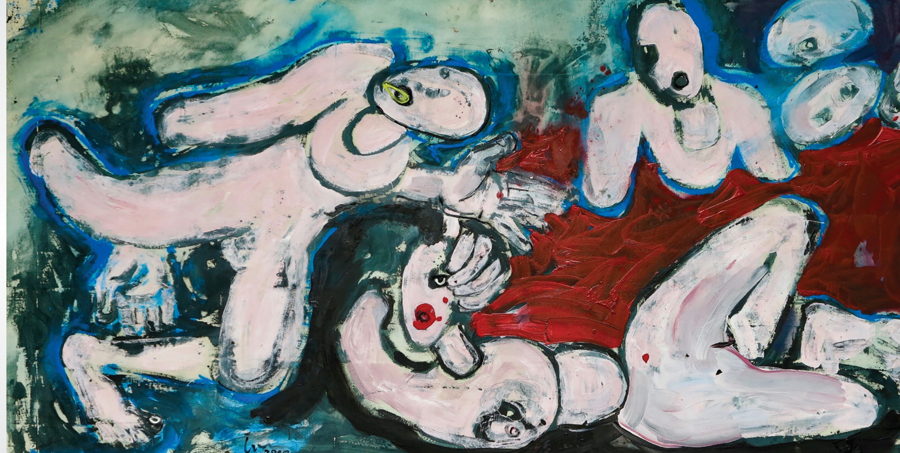
Bad 155 x 322 cm

Der Künstler lebt und arbeitet in Ivanka pri Dunaji nahe Bratislava und in Wien.