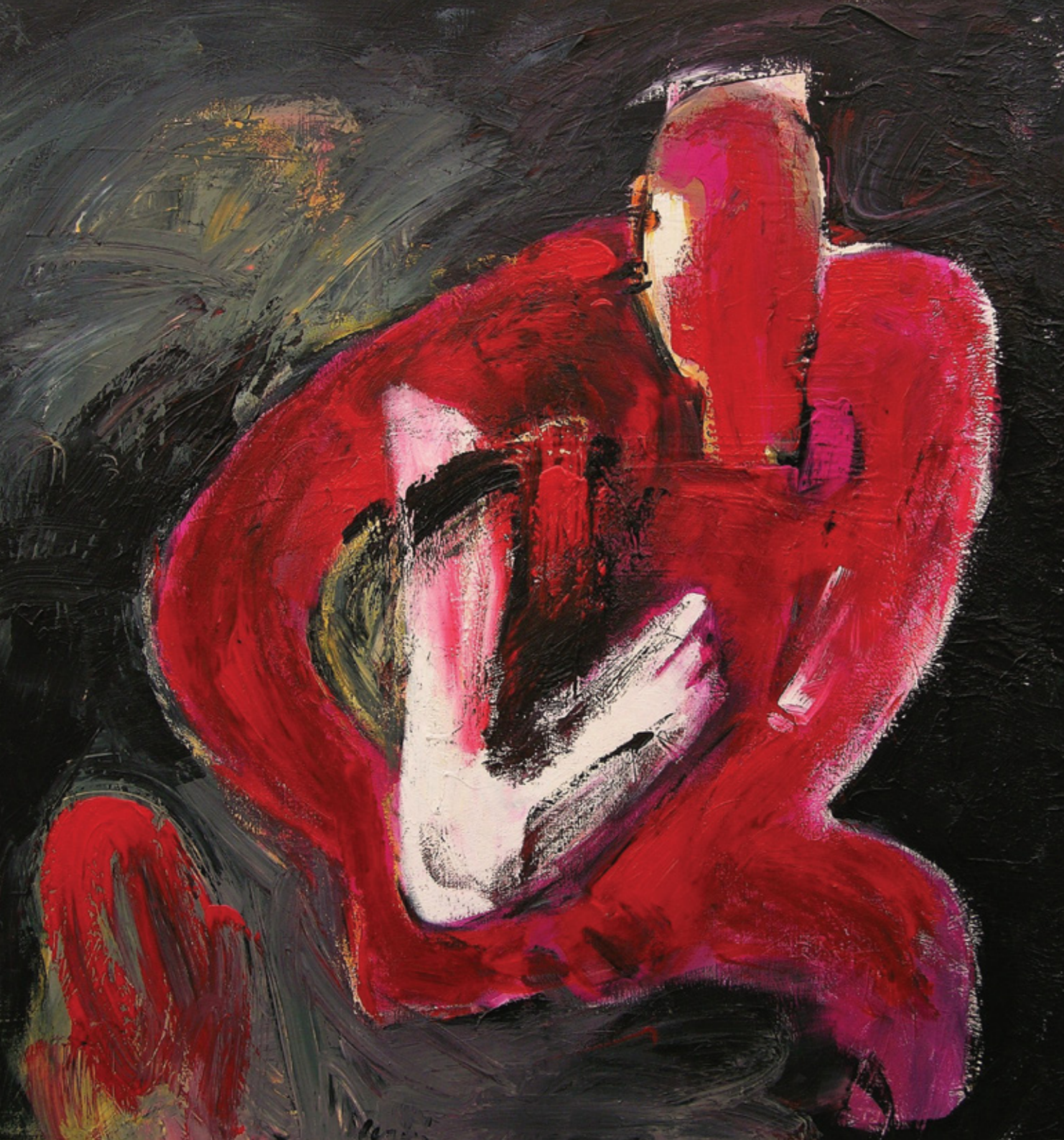
Dieb der Gedanken 150 x 150 cm