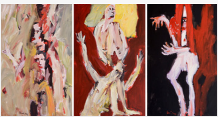
Liebe, Leben, Tod | 3 Teiler 150 x 322 cm

Damit öffnet Černý dem empathischen Betrachter eine Welt, die ihn aus der ganz normalen Hektik des Alltags in einem meditativen, sinnlichen Raum entführt.