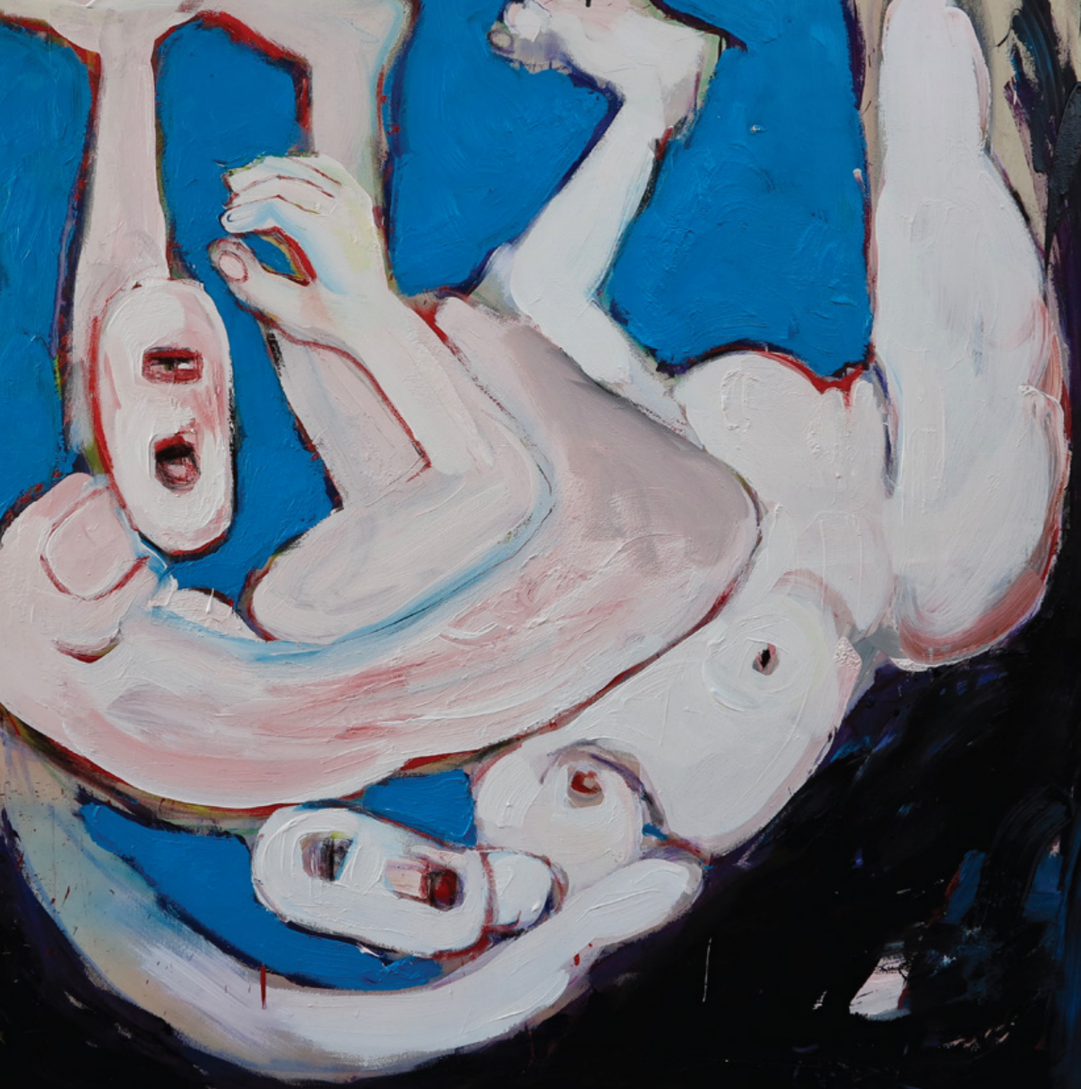
Freier Fall 160 x 150 cm