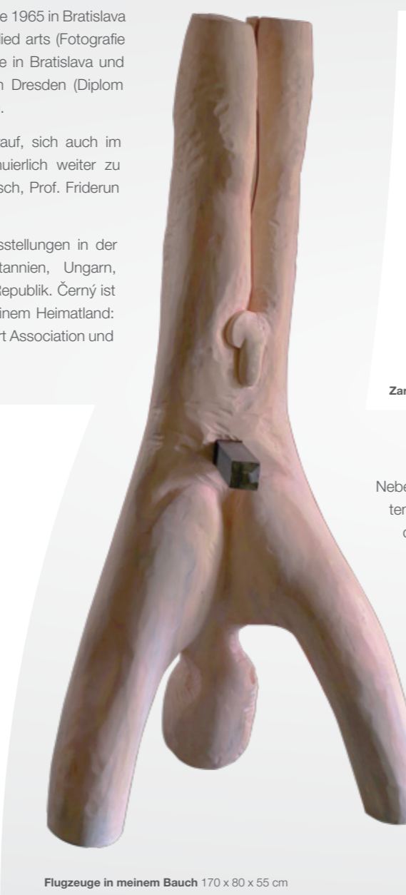
Flugzeuge in meinem Bauch 170 x 80 x 55 cm

Seit 1999 zahlreiche Solo- und Gruppenausstellungen in der Slowakei, Österreich, Frankreich, Großbritannien, Ungarn, Deutschland, Polen und der Tschechischen Republik. Černý ist Mitglied von drei Künstlervereinigungen in seinem Heimatland: der Association of Slovak artists, der Slovak Art Association und der Society of Free Artists.