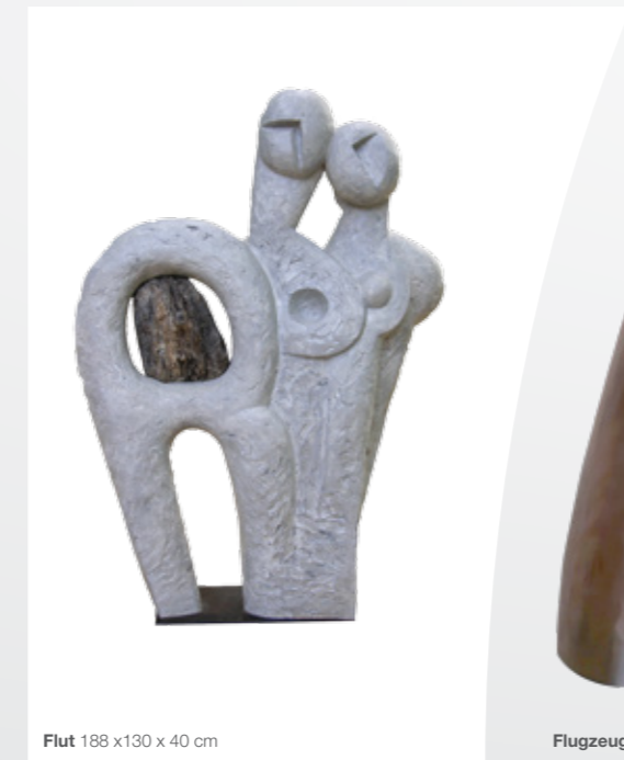
Flut 188 x 130 x 40 cm

Charakteristik und Vita. Ladislav Černý wurde 1965 in Bratislava geboren und studierte an der School of applied arts (Fotografie und kommerzielle Grafik), der Kunstakademie in Bratislava und an der Hochschule der bildenden Künste in Dresden (Diplom Restaurierung | Prof. Dr. Ingo Sandner | 1991).