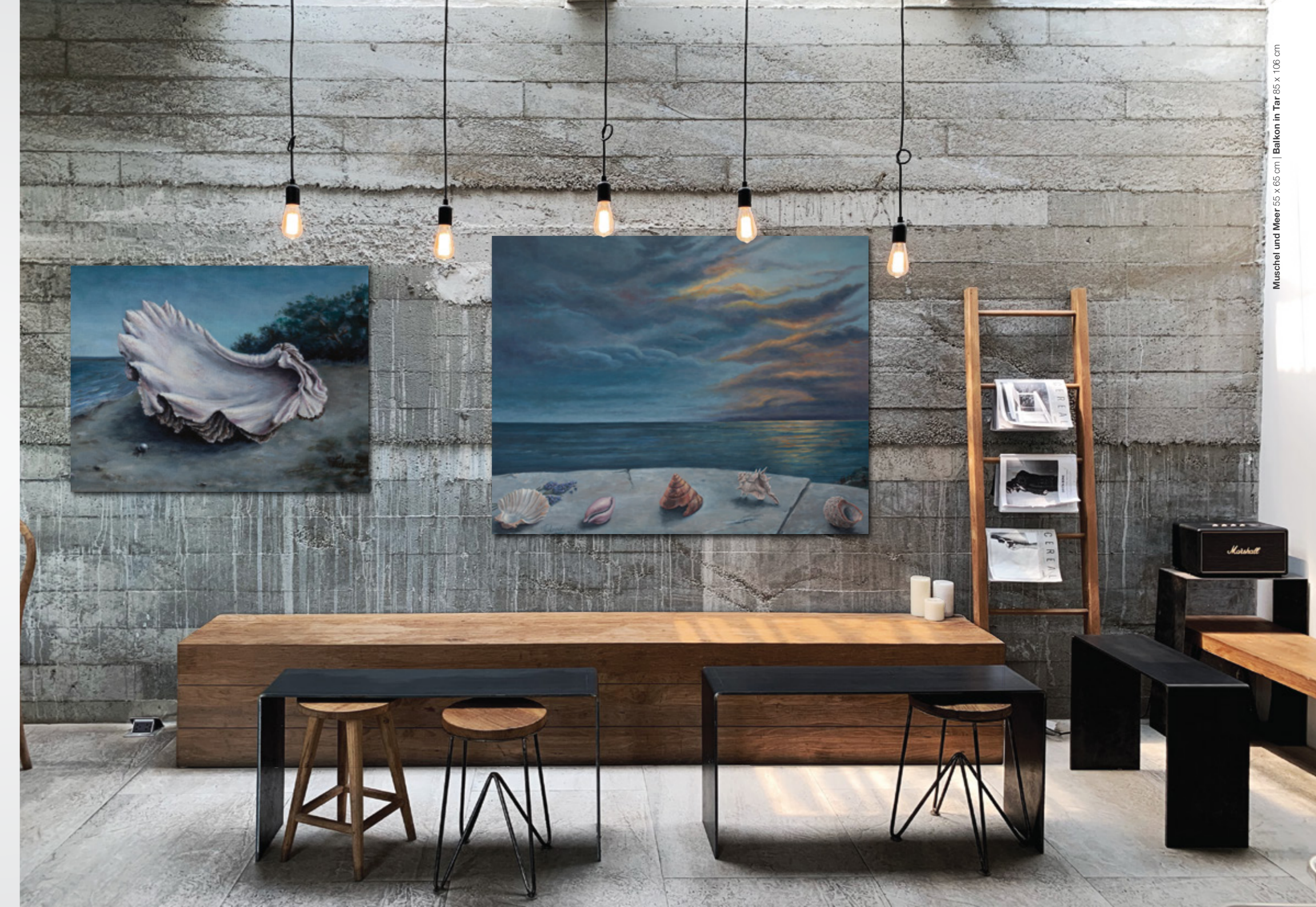
Muschel und Meer 55 x 65 cm | Balkon in Tar 65 x 106 cm

Vidović's Gemälde befinden sich in einigen Privatsammlungen in ganz Europa.