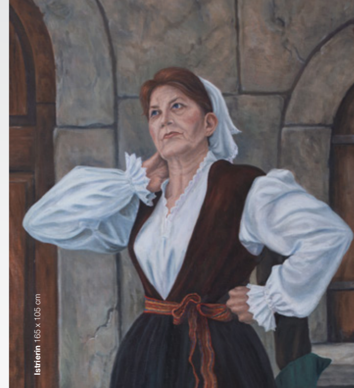
Istrien 168 x 105 cm

Die BURN-IN Vortragsserie Regionale Identitäten in Dallas, Denver und Oklahoma City liefert interessante Einblicke.