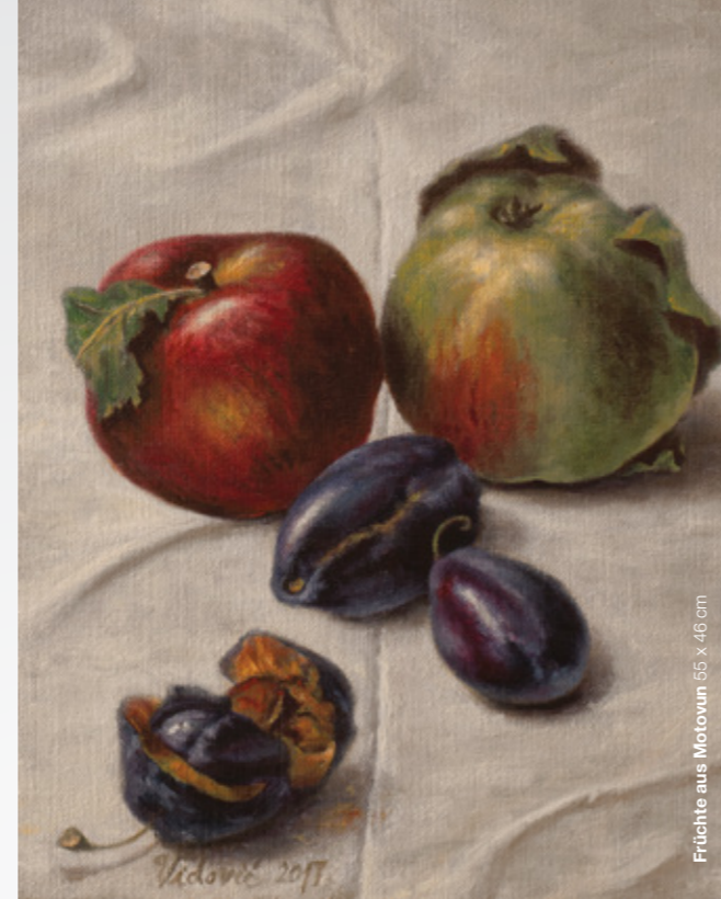
Früchte aus Motovun 55 x 46 cm

Die Bilder sind Metaphern für ein kompromisslos lebensbejahendes Naturverständnis. Sie führen in eine metaphysische Welt, in der die Unterschiede zwischen lebender und toter Materie aufgehoben sind. Ihre archaischen Kompositionen sind voller Weisheiten, die in einer fast magischen Beziehung stehen. Sie existieren jenseits von Zeit und Raum als