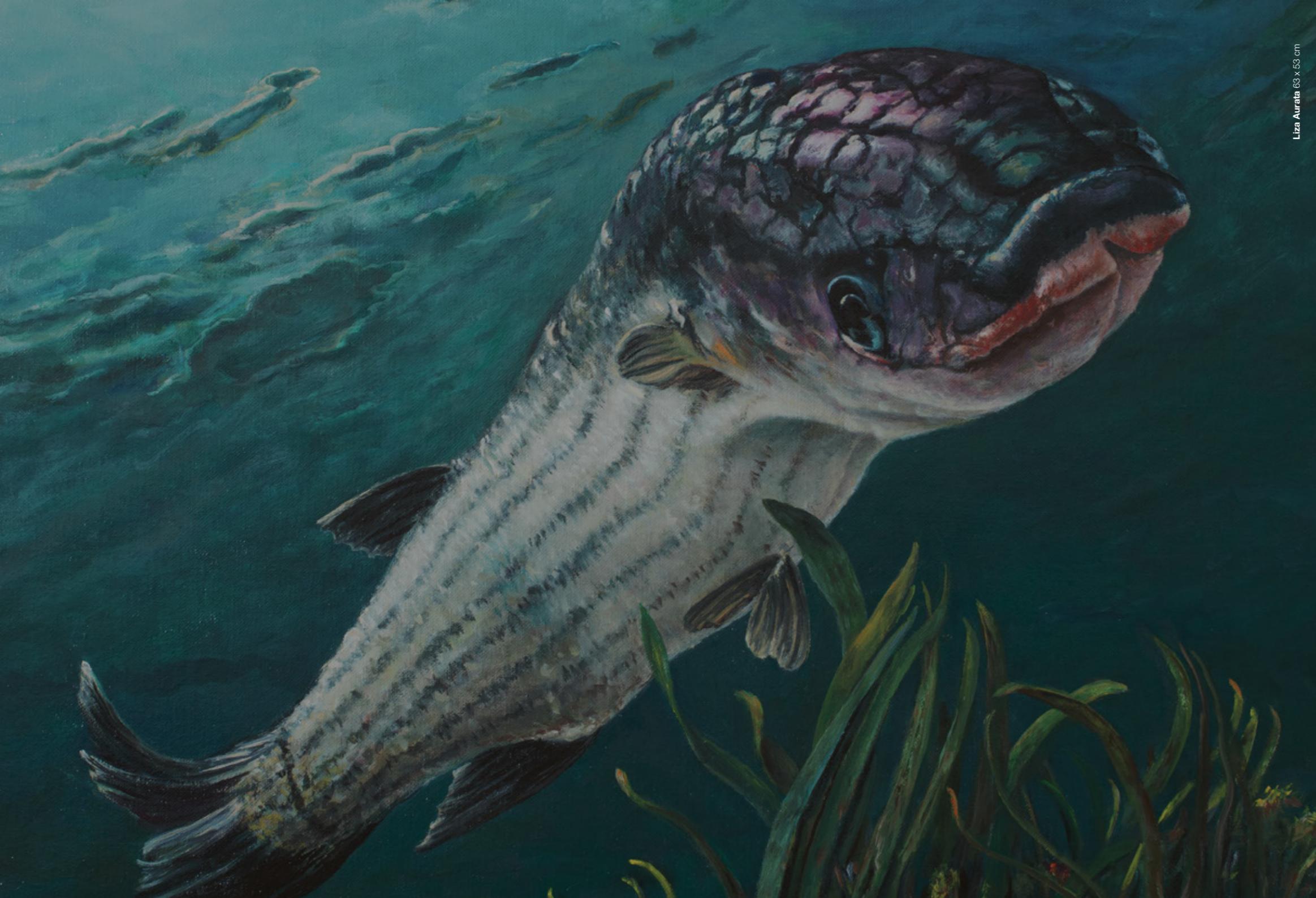
Liza Aurata 63 x 63 cm