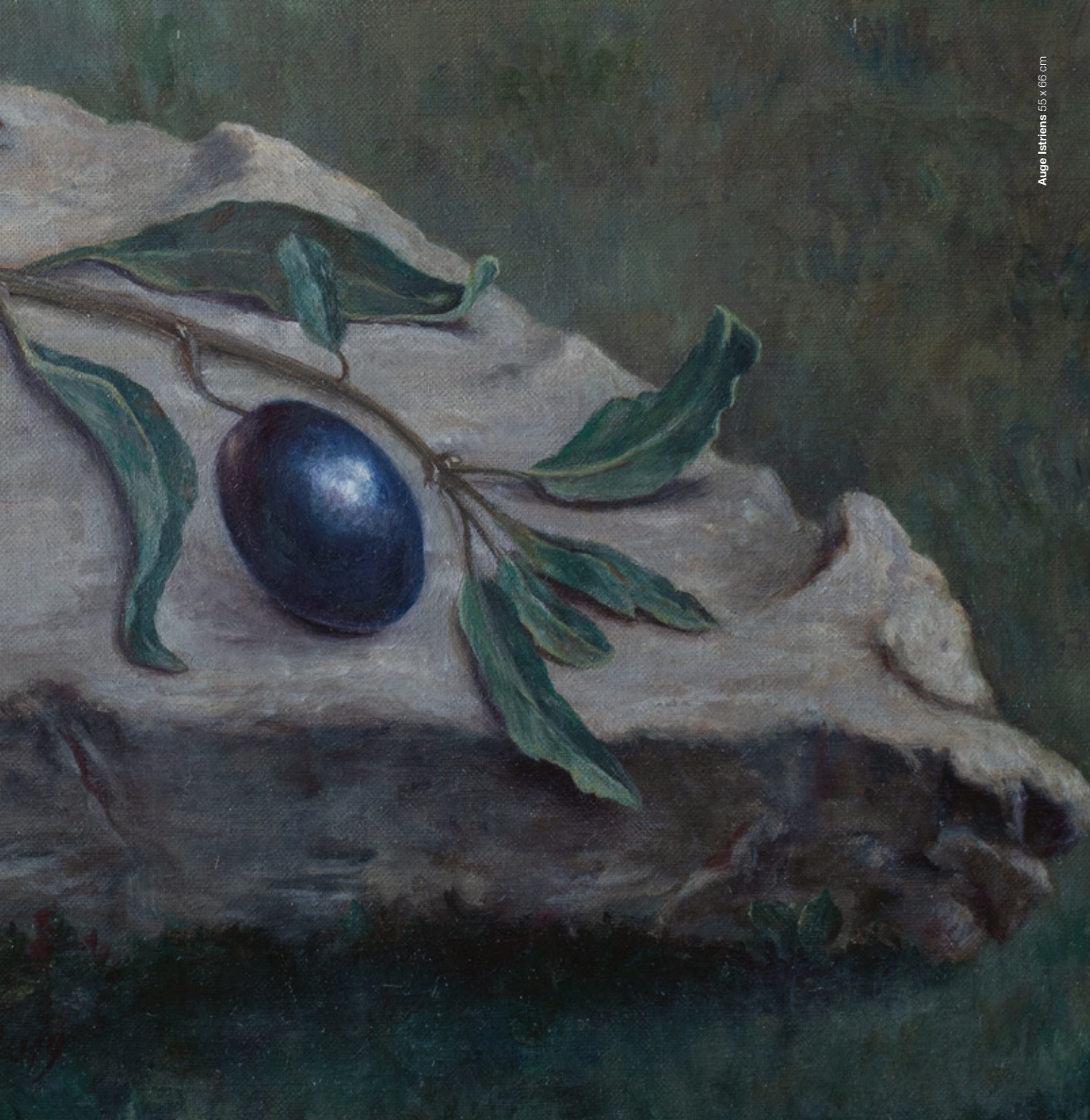
Auge Istriens 55 x 66 cm