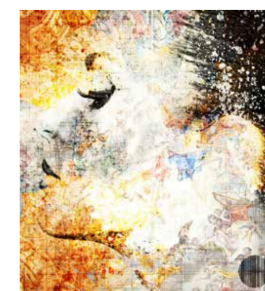
„Oberammergau extrem“ von Jürgen Norbert Fux