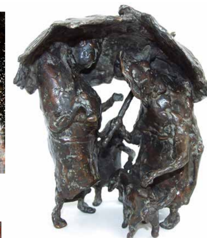
„Marktstand“ von Wolfgang Binding