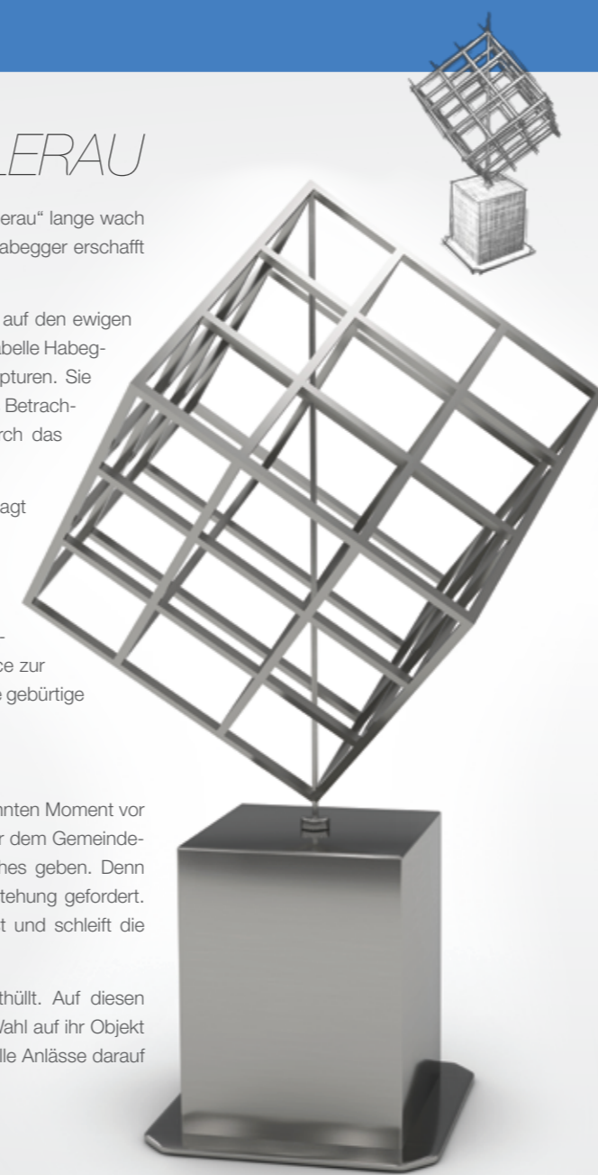
CUBUS | Isabelle Habegger | Visualisierung

Festjahrseröffnung: 26.11.2016, 16:15 Uhr | 8832 Wollerau | Dorfplatz